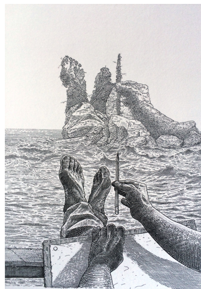
István Orosz, Island drawer

Sietiņš è capo del dipartimento di grafica all'Accademia di Belle Arti di Riga ed è membro di numerose associazioni internazionali dedicate alla grafica; ha esposto le sue opere in moltissimi paesi, ed è considerato uno dei massimi artisti a livello mondiale nel campo dell'incisione a mezzotinto.